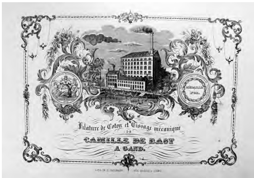
Afb. 4. Katoenspinnerij De Bast aan de Coupure rechts bij de hoek van de Iepenstraat (porceleinkaart, tweede kwart 19de eeuw).