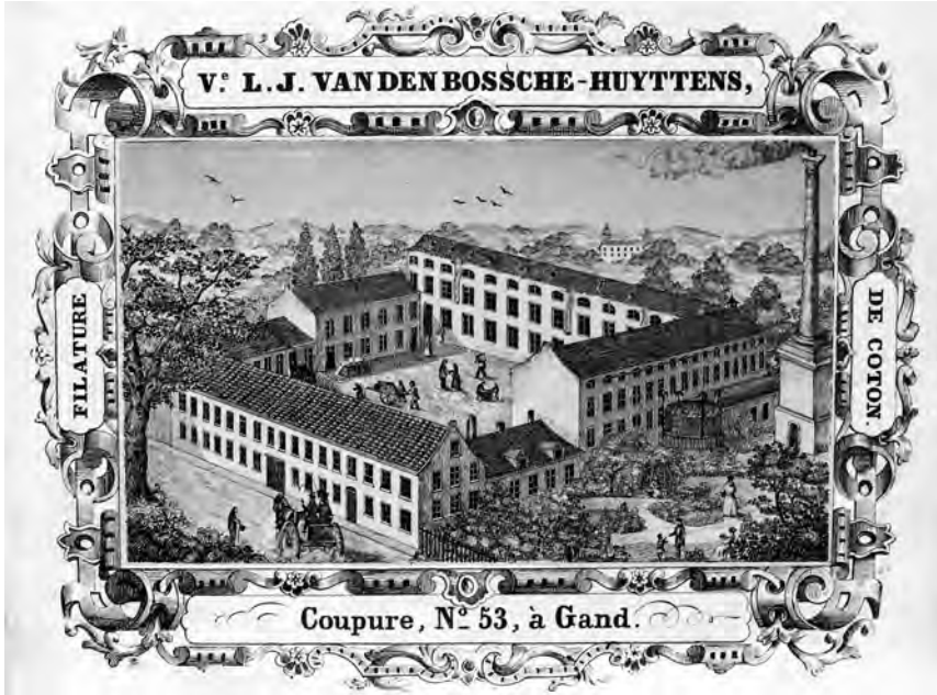
Afb. 3. De katoenspinnerij Van Den Bossche - Huyttens, Coupure links (porceleinkaart, tweede kwart, 19de eeuw (verzameling Rosa De Vriendt – Mores). De schouw rechts geeft een goed beeld van wat de Gazette bedoelt met ‘fabrieksschouwen als erezuilen’.