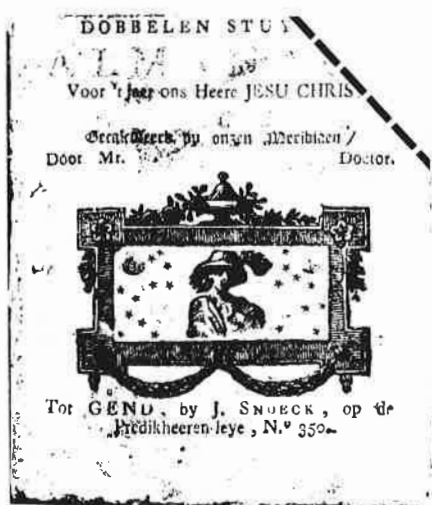
Kaft van één der oudste Snoeck's Almanachs, dd. 1806.